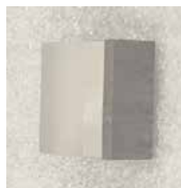
図3 試作した階段状ミラー

本実験システムを用いて、基本的にDMDを用いてレーザー光の走査を行えることを実験によって示した。また、階段状ミラーではなく、表面にアルミ蒸着を施したプリズムキューブをDMDの上に置いて、DMD表面とプリズムキューブの内面とでレーザー光を複数回反射させる手法も開発し、プリズムキューブの試作とそれを用いた実験も行って、同様にレーザー光の射出方向を変化させられることを示した。