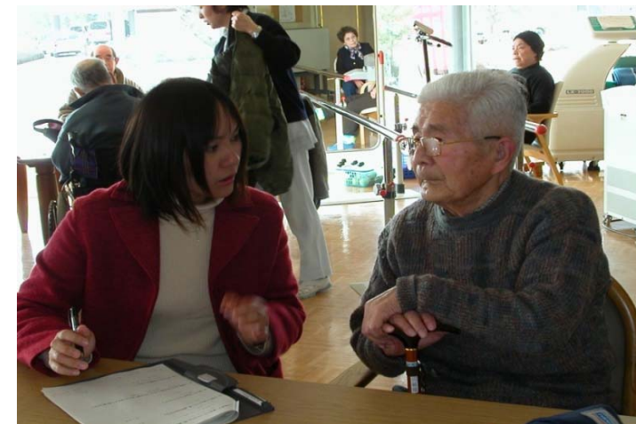
高齢者の温冷感申告と室内温熱環境(PMV)との関係

室内温熱環境(横軸PMV)の変化に対し、高齢者の温冷感申告は「どちらでもない」に集中しており、温熱感の鈍化がみられる。