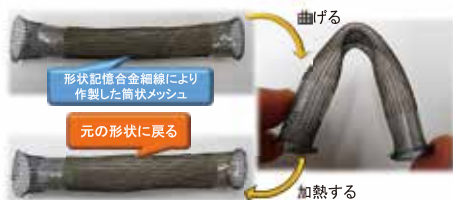
図1 形状記憶合金細線による筒状メッシュの変形と形状回復

形状記憶合金(SMA)は「変形させても加熱により形状が元に戻る」という特異な性質を持つ合金です。図1に示すように、形状記憶合金細線を使用した筒状メッシュは変形させても加熱により元の形状に回復していることがわかります。数ある形状記憶合金の中でもTi-Ni系形状記憶合金は機械的特性、繰返し特性、生体適合性に優れるだけでなく、形状回復時に筋肉の1000倍以上という、非常に大きな単位体積あたりの出力を示すため、例えば民生・工業分野では炊飯器の調節工や新幹線のブレーキシステム、医療分野では自己拡張型ステントやガイドワイヤーなど幅広く応用がなされています。