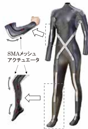
図3 布状形状記憶合金アクチュエータ素子を用いたウェアラブルアシストスーツ

この布状アクチュエータ素子は布状であるため、3次元的な変形動作も可能なアクチュエータ素子として活用することもできます。そのため、現在急速に進む高齢化や、労働作業負荷の軽減に対応するために研究開発が行われている「ウェアラブルアシストスーツ」(図3)への応用が期待されます。表1にアシストスーツ用駆動素子の性能比較表を示しますが、布状形状記憶合金アクチュエータ素子は出力ではモーターに劣るが軽量であり、ゴムなどには重量で劣るが出力では勝り、ゴムやモーターとは違う特徴を持つことがわかります。そのため、モーターやゴムと組み合わせることでより高性能なアシストスーツを開発するための駆動素子としての活用が期待できる素材であり、現在、さらなる研究開発を行っております。