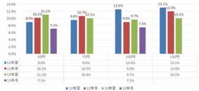
図2 2012年度の夏から2013年度の冬までの節電効果の結果

図1は夏(6月から9月)と冬(12月から2月)のダイナミックプライシングの料金体系です。東田地区では30分単位で電力使用量が計測でき、無線でそのデータが転送されるスマートメーターが設置されていたため、1時間単位で電力料金の単価を変えることができます。このような料金体系を導入することで、東田地区の居住者1世帯当たりの平均電力使用量の削減率は次の図2のような結果になりました。このフィールド実証で明らかになったことは、電気料金を上げることで電力使用量を抑制することは可能で、さらに約9%から13%の電力使用量の削減が実現できたことです。