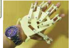
図3 手指装着型リハ装具のプロトタイプ

めの装置を3Dプリンタなども用いて開発中である。これらの制御には近年流行のLeapMotion等を入力デバイスとして用いることで様々な応用が期待できる。