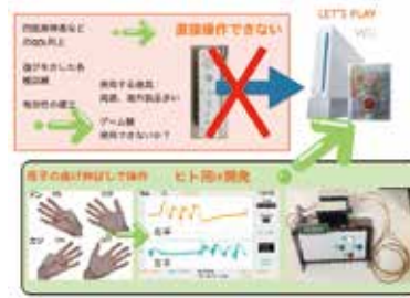
図2 EMG(筋電位)を用いた市販ゲーム機のリハ応用例

さらにFig.3に示すように外骨格装具と同様の感覚で、手指に装着してモータ等により強制的に手指の屈曲を制御するた